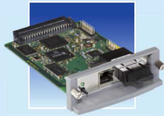
PS26 für Glasfaser