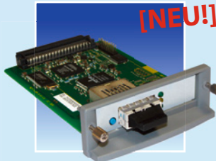
PS1126 für Gigabit Glasfaser