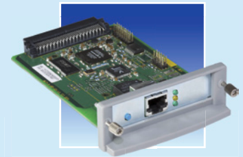
PS1106 für Gigabit (Ethernet)

In enger Zusammenarbeit mit Hewlett Packard entwickelt SEH seit 2000 Einbaukarten zur Netzwerk- anbindung von HP Drucksystemen. Das Ergebnis: Ein komplettes Printserver-Portfolio für alle HP Druck- systeme mit EIO Port: