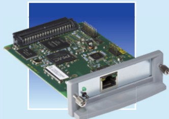
PS06 für Ethernet/Fast Ethernet