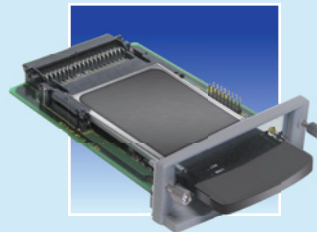
PS56 für WLAN